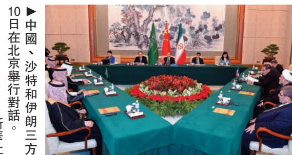
10日中國、沙特和伊朗三方在北京舉行對話。

@AnnelleSheline 美國在中東政策的結果是增加了武器銷售和對伊朗開戰的可能性；而中國緩解了緊張局勢，增加了在也門等國實現和平的可能性。中國正在幫助建立一個以合作和貿易而不是衝突和武器銷售為特點的中東關係！