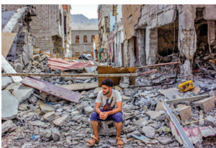
▲美國不斷刺激中東局勢，圖為也門被轟炸後慘狀。 網絡圖片