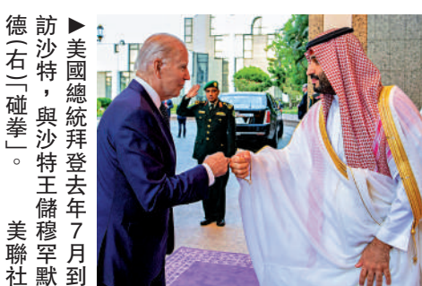
▲美國總統拜登去年7月訪問沙特，與沙國王儲薩勒曼會晤。

【大公報訊】綜合《華爾街日報》、《紐約時報》報道：在中國積極斡旋下，伊朗與沙特這對歷史宿敵恢復外交關係，