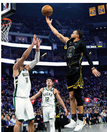
▲史提芬居里（右）再次成為勇士取勝的最大功臣。