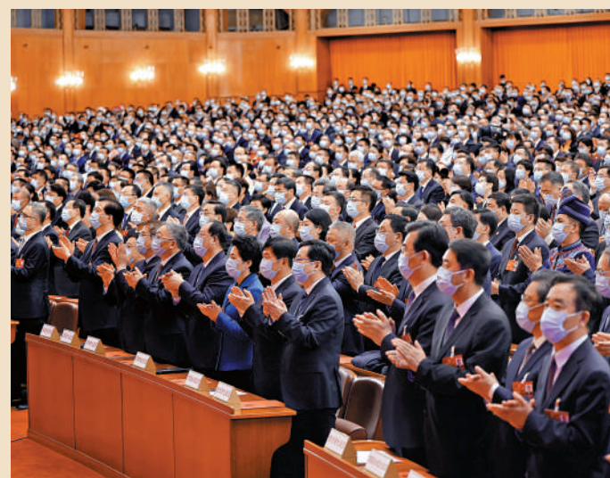
◀3月13日，十四屆全國人大一次會議在北京人民大會堂舉行閉幕會。圖為全國人大代表們起立鼓掌。

香港特別行政區行政長官李家超、澳門特別行政區行政長官賀一誠列席會議並在主席台就座。