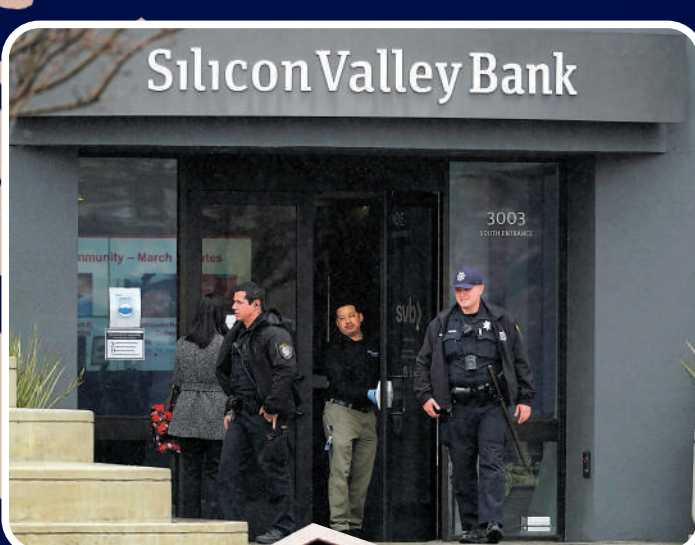
美國硅谷銀行10日倒閉，加州警察當天在銀行大樓附近巡視。

硅谷銀行倒閉不僅衝擊美國初創企業及銀行業，還將風險輸出至全球。硅谷銀行在英國、加拿大、丹麥、德國、印度、以色列和瑞典等國均設有分行。英國滙豐銀行宣布以1英鎊收購硅谷銀行英國分行，交易已達成；德國聯邦金融監管局宣布暫停硅谷銀行德國分行業務。