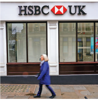
滙豐銀行以1英鎊的價格收購了硅谷銀行英國分行。美聯社

技行業。硅谷銀行在英國、加拿大、丹麥、德國、印度、以色列和瑞典等國均設有分行。德國聯邦金融監管局13日宣布，將暫停硅谷銀行德國分行的業務。截至去年底，硅谷銀行法蘭克福分行的資產為7.89億歐元。受事件影響，歐洲股市13日大幅下跌，意大利和瑞士的銀行股跌幅尤其嚴重。City Index分析師辛科塔表示：「投資者在歐洲各地拋售風險資產，對危機蔓延的擔憂非但沒有平息，反而進一步加劇。投資者將目標對準西班牙和意大利的銀行，隨着恐慌加劇，這些銀行被認為是最薄弱的環節。」