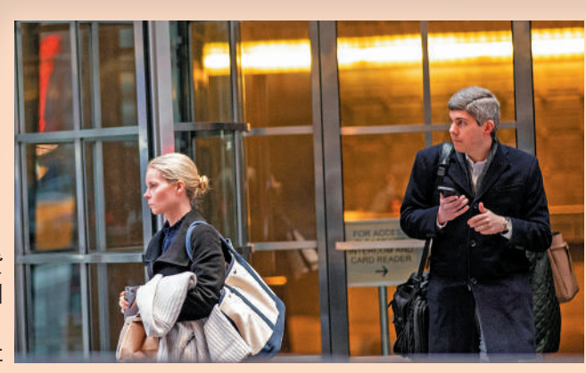
支持加密貨幣業務的美國簽名銀行12日關閉。