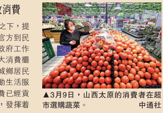
▲3月9日，山西太原的消費者在超市選購蔬菜。

滕泰認為，在促消費手段上，增加居民的一次性收入，有地方政府發消費券等手段，對消費的拉動是立竿見影的。其次，居民的財產性收入，包括房租、股市和債券的投資、存款收益等，金融資本市場的收益已經成為居民可支配收入的重要組成部分。