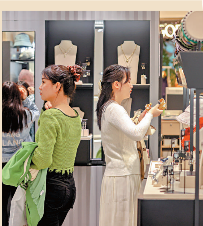
▲3月8日，消費者在江西南昌一商場內挑選商品。