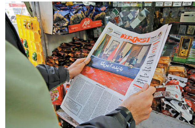
▲國際社會歡迎沙伊復交，讚賞中國在其中發揮的積極作用。

美國《華爾街日報》指出，中國向外界展示自己與美國的不同之處——與各方交流，同時不在人權問題上進行說教。中國促成沙伊關係緩和，加快了中東的地緣政治調整。