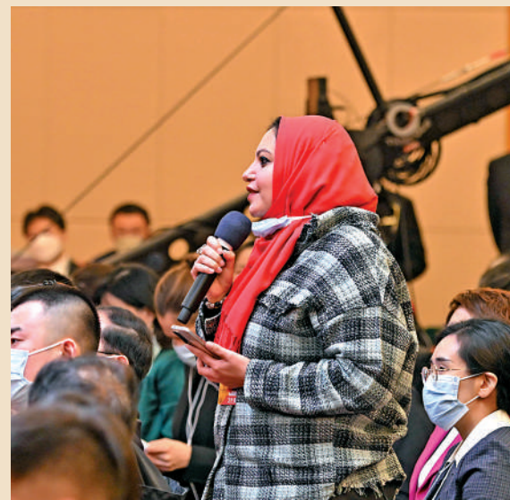
◀中國經濟發展成就卓著，令國際社會讚嘆。