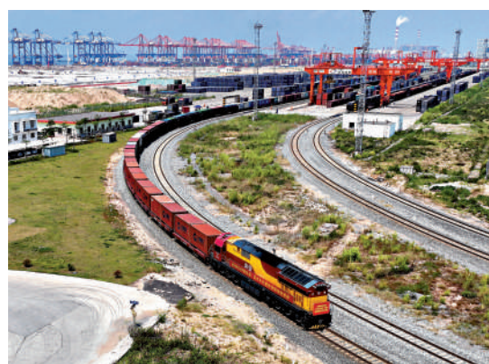
▲全過程人民民主為中國社會經濟發展奠定了堅實的基礎。

【大公報訊】據尼日利亞《抨擊報》報道：尼日利亞中國研究中心主任查爾斯·奧努納伊朱指出，兩會彰顯中國政治制度優勢，其重大意義不僅在於其代表性和參與性的民主內涵，還在於兩會要勾畫重要政策議程，並對國家行政和治理提供反饋。中國獨特的政治進程和多黨合作的社會主義民主制度取得了實實在在的成果。