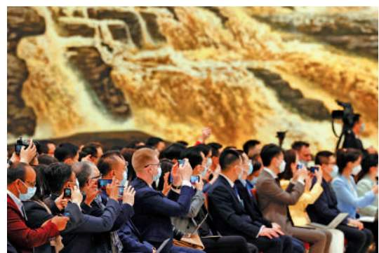
▲3月13日，十四屆全國人大一次會議在北京人民大會堂舉行記者會。

盧科寧認為，兩會是中國特色社會主義民主制度的生動範例。「對於幅員遼闊、人口眾多的中國而言，維護國家穩定並專注於實現自