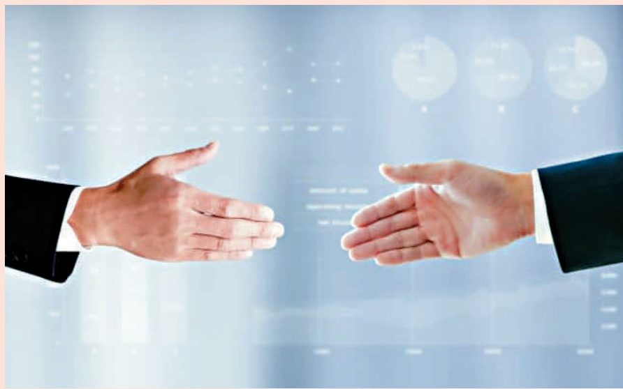
▲與他人「和解」已屬不易，與自己「和解」更加困難。不單需要正視自己，更需要足夠的耐心與時間。

我們在這個社會生存，需要與他人和解，更需要與自己和解。與自己和解，主要從四個方面來進行：一是根據現實與理想的差距，重新對自己進行定位，我們從學校教育中走出來，首先要對社會現實進行一定的了解，然後尋找自己價值，搞清楚自己的準確定位，既不要盲目自信，又不要妄自菲薄wàng zì fēi bó。二是接受自己在某些方面、某些領域的無能為力wú néng wéi lì。每個人既有自己的天賦所在，又有自己的薄弱領域，不能因為自己在某些方面的薄弱而對自己感到巨大失望。三是及時反思，抓住與自和解的