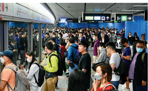
▲港鐵因「封頂機制」已連續三年凍價及減價，但今年有機會加費2.8%。

陸續有來 港鐵可加可減票價機制的調整結果，將於本月底出爐，疫情期間因為觸發「封頂機制」，已然連續三年凍價及減價。