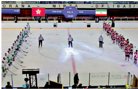
▲香港對伊朗的冰球世錦賽賽事，出現播錯中國國歌的情況。 資料圖片

【大公報訊】中國香港體育協會暨奧林匹克委員會對於早前世界冰球錦標賽播放國歌出錯事件，昨天作出補充回應，港協暨奧委會知悉相關賽事主辦機構已承認事件為人為錯誤所致，港協暨奧委會再次促請冰協從速交代詳情，讓港協暨奧委會以公平客觀的方式作出判斷。