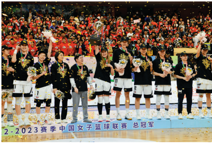
2-2023賽季中國女子籃球聯賽總冠軍