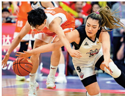
▲李夢（右）在比賽中拚搶。

作為中國女籃的主力前鋒，李夢榮膺東京奧運會女籃外圍賽所在小組的MVP（最有價值球員）。