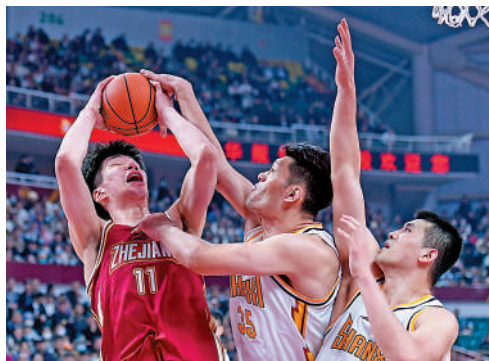
▲浙江稠州金租隊（紅衫）暫列CBA榜首。 資料圖片