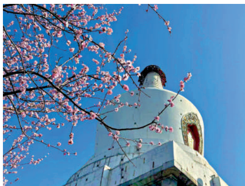
▲北京北海公園春花盛放，與白塔相映成趣。

陽春三月，神州大地春意濃濃，備受矚目的2023年全國兩會在京召開。「梨花淡白柳深青，柳絮飛時花滿城。」在春光明媚的時節，百花競相爭妍，首都北京拉開踏青賞花的春日遊園序幕，今年北京推出121家公園賞花片區，總觀賞面積超過680萬平方米，分布在全市各區，市民「開窗見綠、出門進園」，在家門口就能欣賞春花春景——迎春、山桃、碧桃、紅梅、連翹、玉蘭等一齊綻放，亮麗多彩。東方風來，京城滿眼春意。