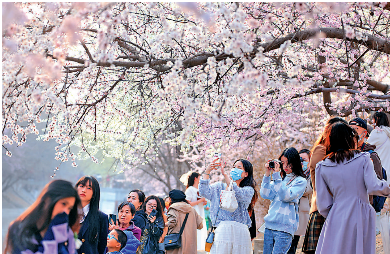
▲近日，北京十里堡的山桃花迎着春風綻放，吸引了大批遊人賞花拍照。