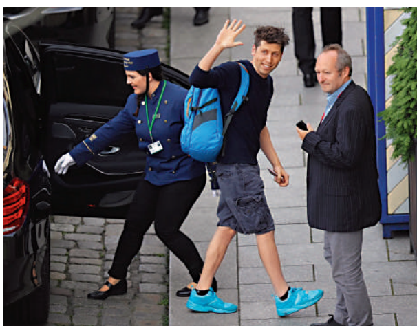
▲OpenAI CEO阿爾特曼。

專注於初創科企業務的硅谷銀行10日突然倒閉，成為自2008年金融危機以來倒閉的最大規模銀行。其倒閉導致許多科企發不出工資。據報道，一家初創公司創始人古爾森在別無選擇的情況下，向阿爾特曼發送求助郵件。沒想到兩個小時內就收到了回覆，並得到對方答應，將提供6位數美元的應急資金，且「沒有提出任何其