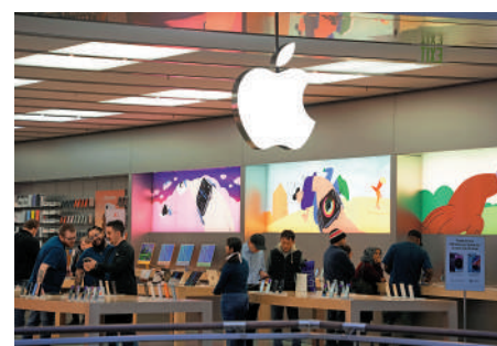
▲蘋果近日宣布延後部分部門獎金的發放。圖為位於美國匹茲堡的蘋果商店。

企紛紛裁員的情況，仍然沒有出台裁員措施，蘋果員工的處境已經相對較好。相比之下，Meta則將在未來兩個月內再裁員1萬人，並取消約5000個空缺職位。今年以來，美國科技企業已裁員近10萬人。自2022年初以來，全球科技公司已裁員近30萬人。