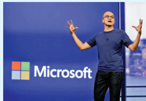
▲微軟CEO納德勒。戶，收費為每月20美元。同時，圖像輸入功能暫未向公眾開放。

令人驚喜的是，GPT-4還加入解析圖像的功能。針對用戶發送的圖片，GPT-4除了可解釋內容以外，還能給予建議、回答問題。在官方演示中，GPT-4幾乎就只花了1-2秒的時間，就識別了手繪圖片，並根據要求手繪圖片上的文字，實時生成了網頁代碼，製作出了相應的網站。不過，GPT-4目前僅開放給部分訂閱ChatGPT Plus的付費用戶。