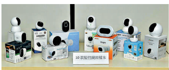
▲消委會測試市面10款家用監控鏡頭，發現當中九款有網絡安全隱患。

消委會建議用戶，不應購買沒有品牌或來歷不明的產品，除了品質沒有保證外，網絡安全未必很完善，若監控鏡頭由專人上門安裝及設置，安裝後應立即更改密碼；此外，市民有需要時才開啟和連接鏡頭，用完立即關掉，避免使用公共WiFi連接登入，以防賬戶資料被暗中記錄及盜取。