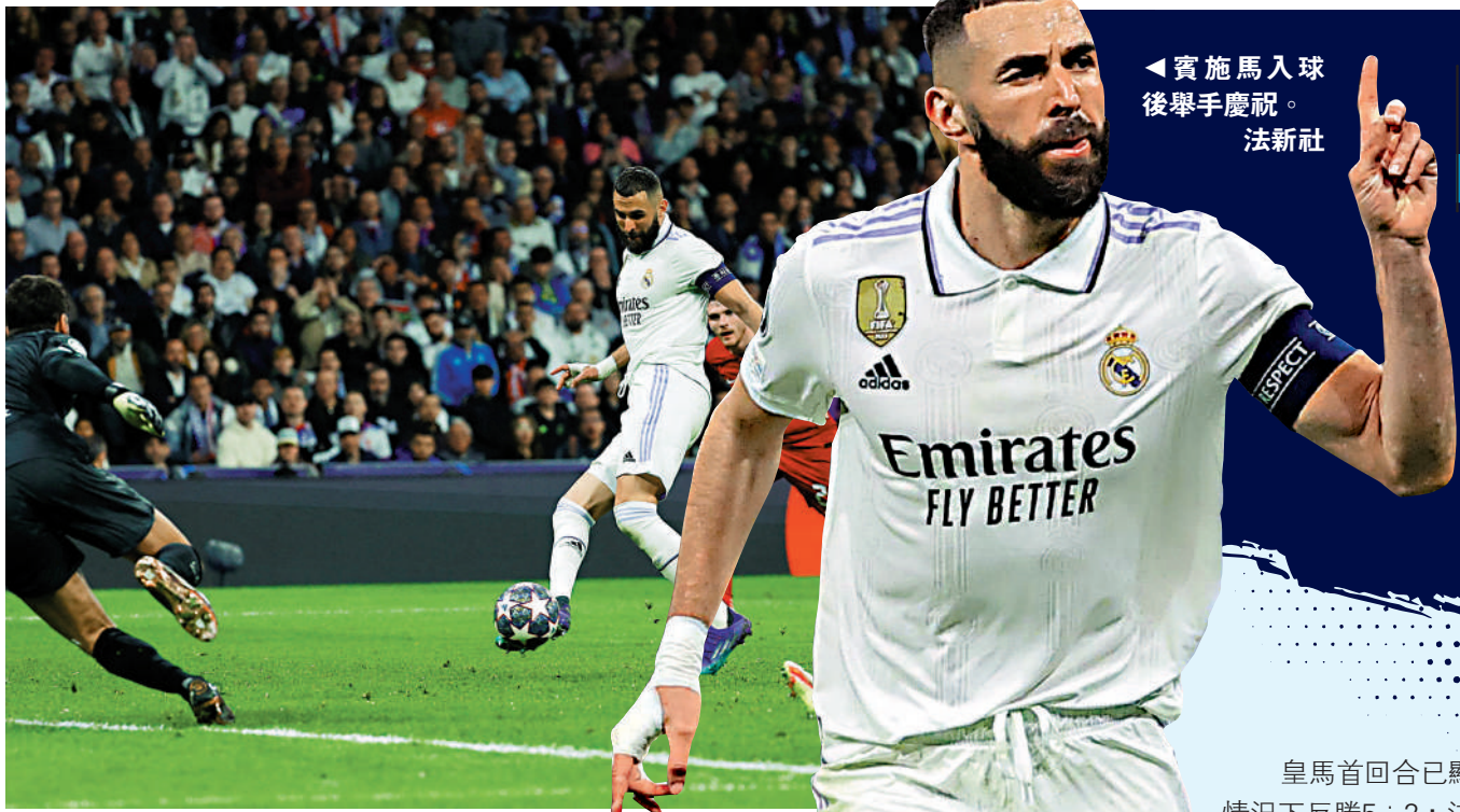
◀賓施馬入球後舉手慶祝。