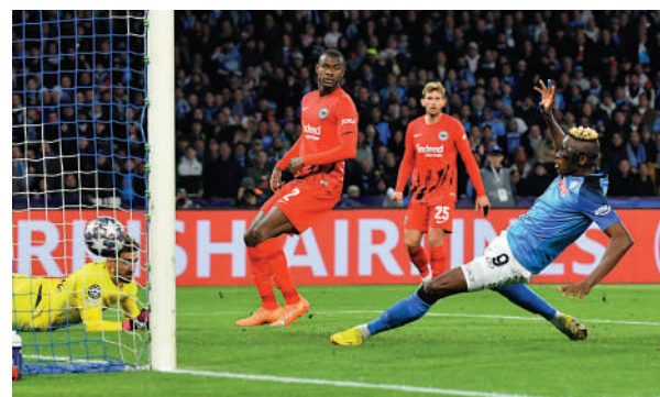
▲拿波里前鋒奧森漢（右）今仗入兩球。

同打入8強，更是球隊歷史上首次，主帥史巴列堤大讚己隊已創造一個偉大成就。域陀奧森漢亦表示，很高興能以一場勝利創造歷史，他與隊友會一同繼續追求夢想，爭取為拿波里贏取歐聯冠軍。