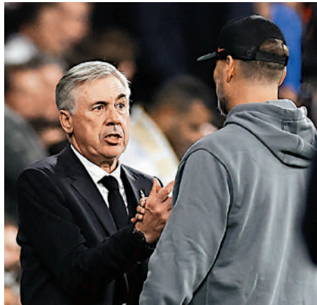
▲安察洛堤（左）賽後與高洛普握手。