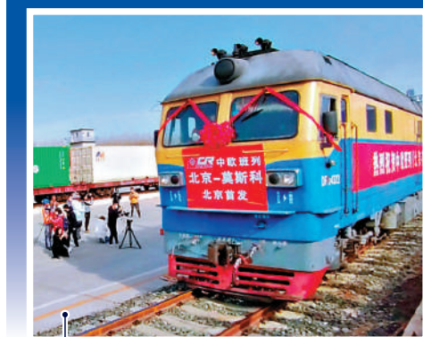
▲3月16日，北京首趟中歐班列正式開行，從北京平谷地方鐵路馬坊站駛向莫斯科。