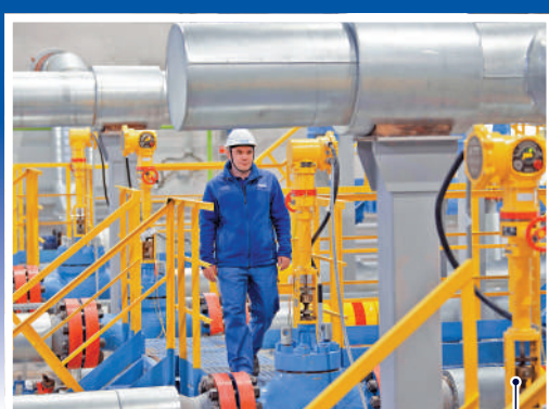
▲中俄東線天然氣管道項目俄境內「西伯利亞力量」天然氣管道去年底全線貫通。圖為工作人員在俄羅斯科維克塔天然氣田內巡視設備。