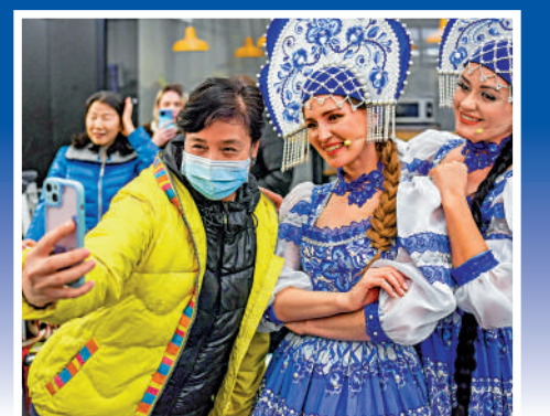
▲2月23日，俄羅斯迎來中國試點恢復出境團隊旅遊業務後的首批中國旅遊團。