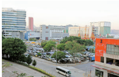
▲▲簡約公屋選址包括柴灣常安街／常平街和啟德世運道。