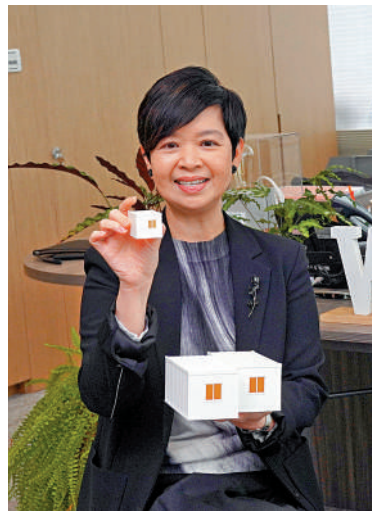
▲何永賢重申政府有決心解決劏房問題，興建簡約公屋事在必行。