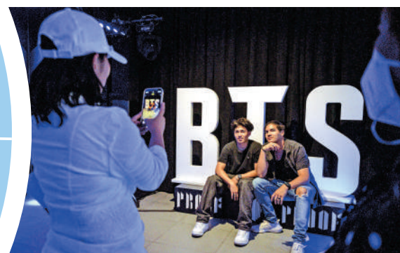
▲有分析師指出，HYBE過度依賴BTS，藝人組合較單一。