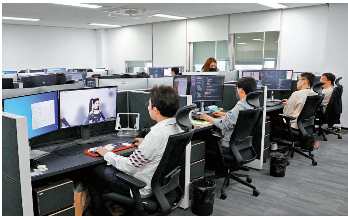
▲韓國2021年每人平均工作時間為1915小時。

根據最新統計，在OECD的成員國中，韓國總和生育率從2013年起已經連續10年排名墊底。