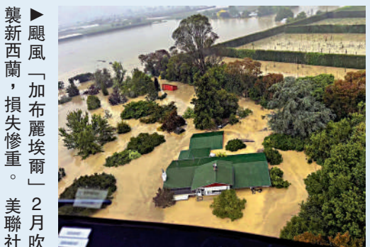
▲颶風「加布麗埃爾」2月吹襲新西蘭，損失慘重。

【大公報訊】據BBC報道：颶風「加布麗埃爾」上月13日吹襲新西蘭北島，引發大規模洪災，造成至少11人死亡，逾萬人流離失所。風災過去一個月之後，還有不少災民不敢回家