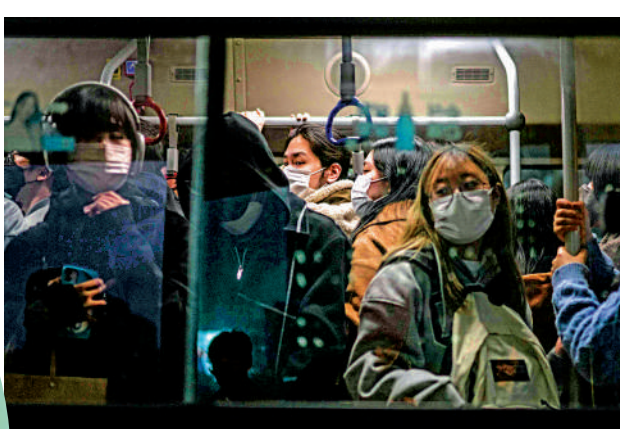
▲韓國首爾15日搭乘巴士的上班族。