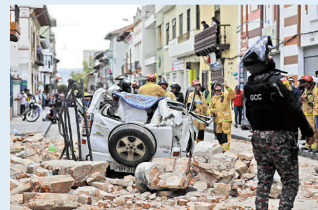
▲厄瓜多爾18日發生6.8級地震，造成多處房屋倒塌。

聲明還表示，至少有44所房屋被毀，另外90所房屋受損。大約50所教育建築和30多個醫療中心也受到影響，多條道路因山體滑坡而受阻。聖羅莎機場受到輕微破壞，但仍在運作。