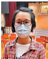
司徒女士 (居旺角劊房)

幽門螺旋菌不時會聽到，有時想了解但不知道用什麼途徑。在香港生活逼人，一家幾口依靠丈夫作家中經濟支柱，所以有時購買食物會將貨就價，或許未能達到相關衛生要求，食用後腸胃出現問題才作求醫，但擔心求醫可能「為時已晚」，如果可預早檢查會嘗試。