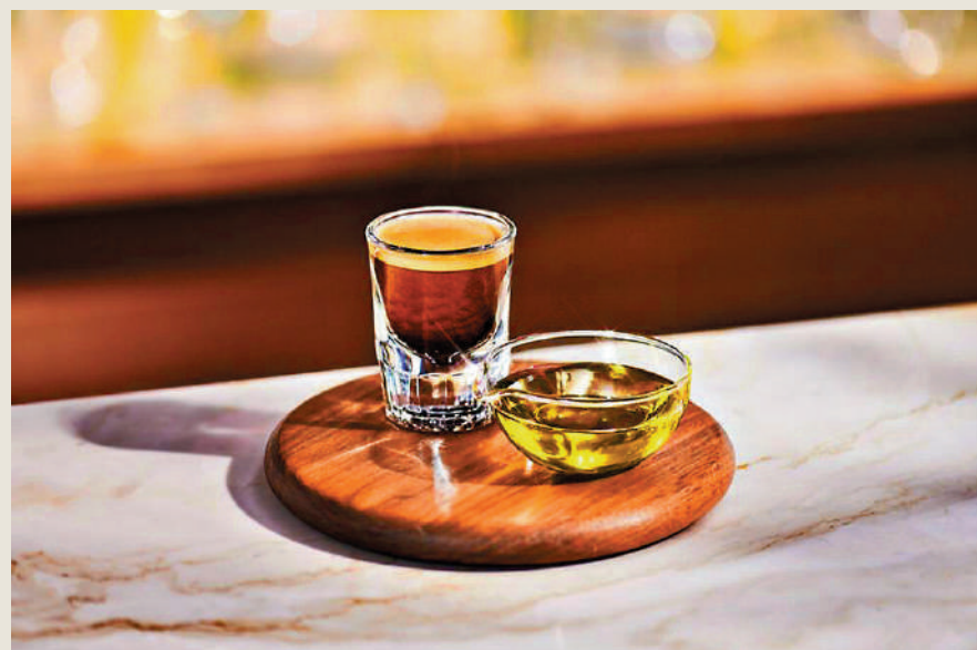
在咖啡裏加橄欖油，創意與否見仁見智。