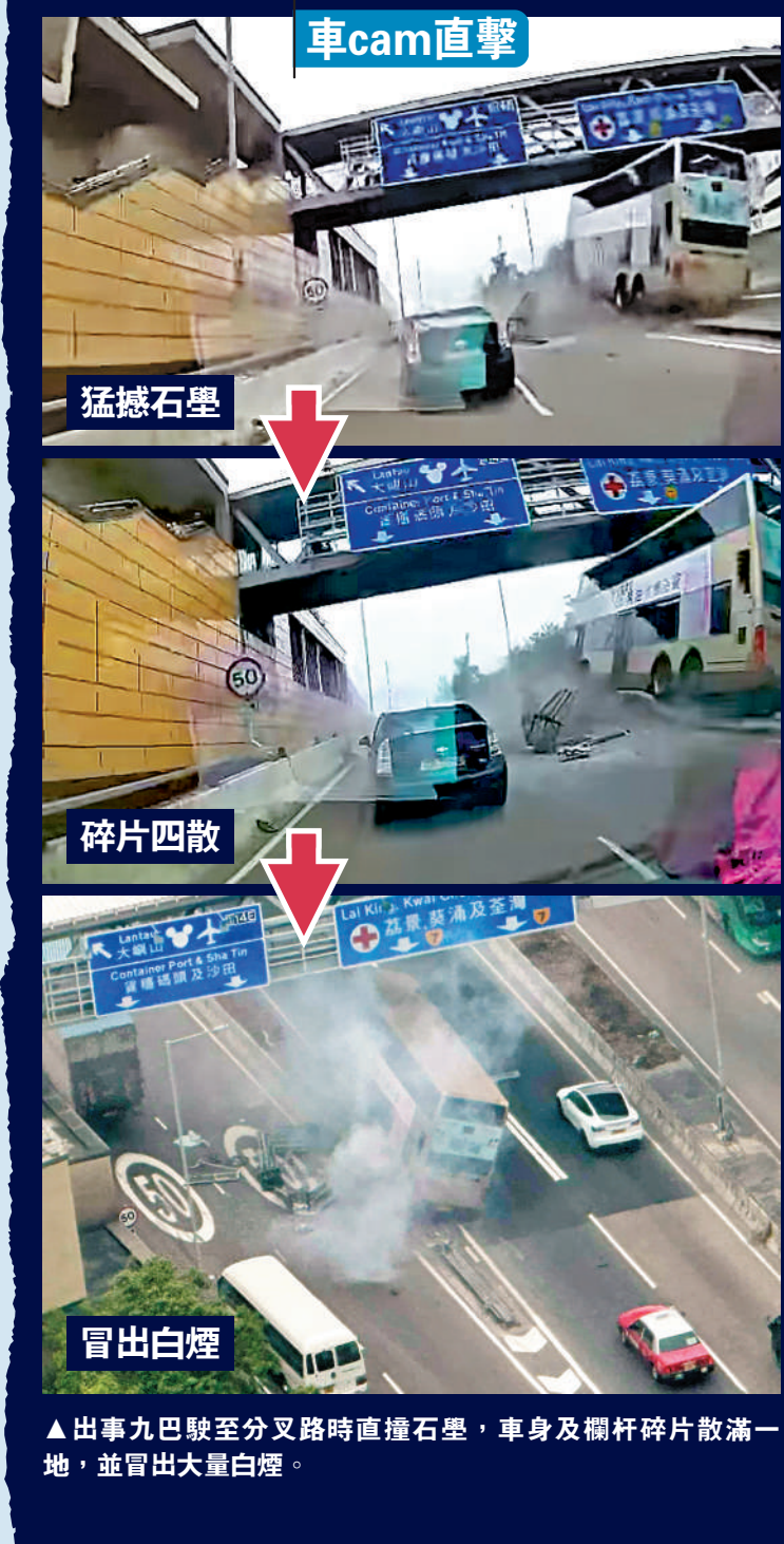
車cam直擊：猛撼石壘、碎片四散、冒出白煙。▲出事九巴駛至分叉路時直撞石壘，車身及欄杆碎片散滿一地，並冒出大量白煙。