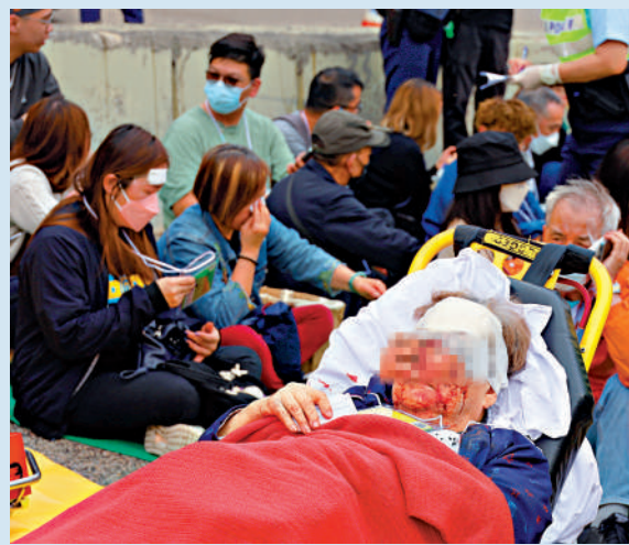
▲有受傷長者血流披面，由擔架床送院。