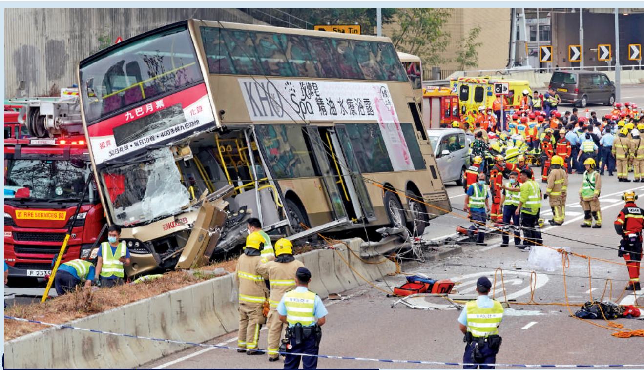
一輛雙層九巴昨日在呈祥道剷上並擱在石壘，全車傾側，消防員到場後以消防車及加固裝置穩定車身，再進入上層救人。