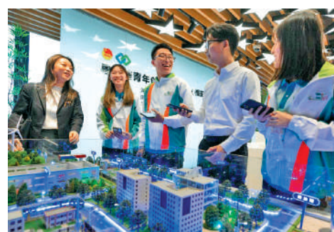
▲團員參觀河套深港科技創新合作區期間，與深圳市青年聯合會的會員交流。

員一同到訪河套深港科技創新合作區，以了解合作區內的規劃建設和科技發展機遇，同時讓兩地青年人加強交流、分享經驗和建立友誼。海關關長何珮珊與交流團等一起參觀深圳博物館，團員們對大灣區自實施改革開放政策以來，所取得的顯著成就留下深刻的印象。何珮珊表示考察團特別選址深圳，是因為深圳和香港的夥伴關係密不可分，兩地均受惠於國家改革開放，在過去四十五年合作無間，涵蓋不同層次及範疇。她期望香港與深圳在青年發展方面繼續合作，為年輕人於大灣區的個人和事業發展創造更多機遇。