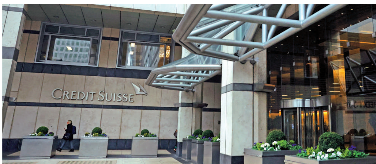
▲美歐銀行信用危機是昨日港股重挫的禍首。

比較之下，內銀股和內險股的防守力就強多了。昨日初段曾見多隻內銀股逆流而上，不跌反升，這包括「四大商銀」及中信銀行(00998)在內，其後因市況低沉，升幅才被湮沒。不過還有3日就公布業績的中信銀行就始終