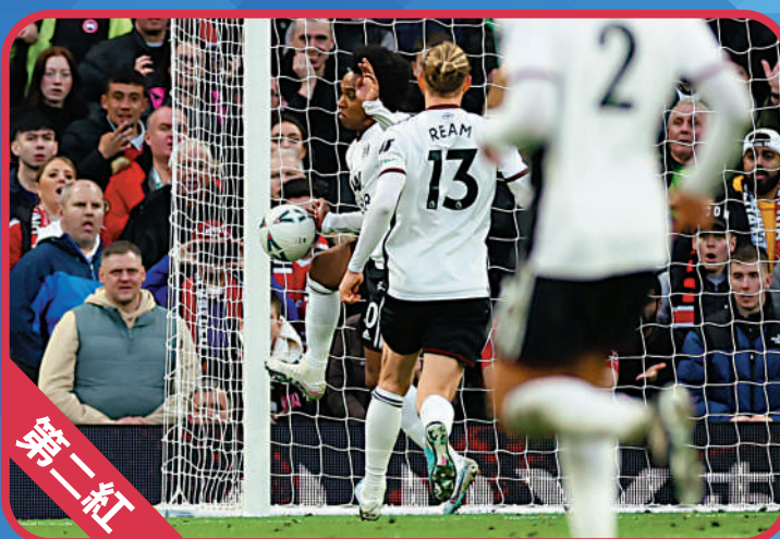
▲韋利安(觸球者)因在禁區犯手球，富咸被罰第二面紅牌。