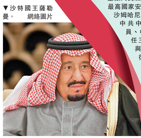
▼ 沙特國王薩勒曼。網絡圖片