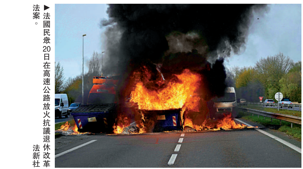
▶ 法國國民眾20日在高速公路放火抗議退休改革法案。

通過。 馬克龍19日表示，政府已經動員起來，以「保護」那些在投票前面臨壓力的議員。 最新民調顯示，馬克龍的支持度跌至28%，為2019年「黃背心」運動以來最低水平。法國《世界報》稱，許多工會人士擔心，隨着示威愈演愈烈，工會可能失去對遊行示威的控制，「黃背心」運動可能重回法國街頭。