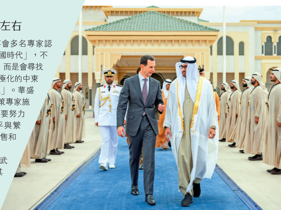
▲ 阿聯酋總統穆罕默德19日到機場迎接敘利亞總統巴沙爾。

3月19日，敘利亞總統巴沙爾到訪阿聯酋，阿聯酋總統穆罕默德親自到機場迎接。穆罕默德表示，是時候讓外交上被孤立已久的大馬士革政府重新回到阿拉伯世界懷抱。