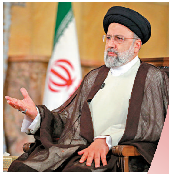
▲ 伊朗總統萊希。

3月10日，中國、沙特和伊朗三國在北京發表聯合聲明，宣布沙特和伊朗達成一份協議，包括同意恢復雙方外交關係，在至多兩個月內重開雙方使館和代表機構；強調尊重各國主權，不干涉別國內政；雙方同意兩國外長盡快舉行會晤等。