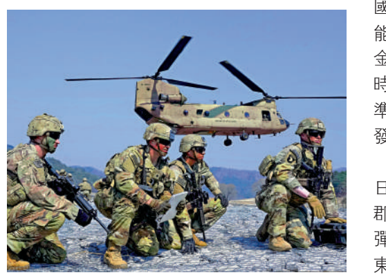
▲ 美韓19日在韓國抱川軍事訓練場進行聯合軍事演習。

【大公報訊】綜合韓聯社、朝中社報道：美韓海軍陸戰隊和海軍20日啟動大規模聯合登陸演習「2023雙龍演習」。由於該演習需出動海軍陸戰隊等大規模兵力，屬渡海登陸到敵方海岸攻佔目標地區的進攻性演習，勢加劇朝鮮半島緊張局勢。 這是該演習時隔5年再次舉行，將從20日起至下月3日在慶尚北道浦項一帶舉行，規模由以往的「旅級」擴大至「師級」，旨在加強美韓同盟的戰鬥準備態勢和互操作能力。這也是目前正在進行的「自由護盾」聯