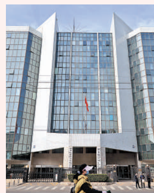
▲國務院港澳事務辦公室在中共中央港澳工作辦公室加掛牌子。圖為國務院港澳辦原址。