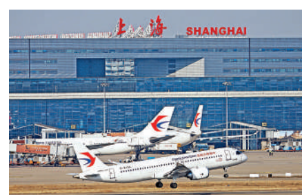
▲圖為上海虹橋機場。