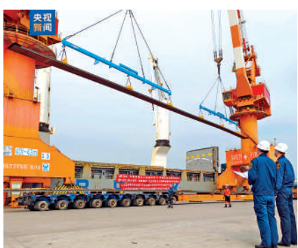
▲國產50米鋼軌在天津港大沽口港區裝載完畢。

據悉，該批項目鋼軌出口總量超過22000噸，鋼軌出口採用「鐵海鐵」聯運方式，預計將於5月底前在天津港全部發運完畢。