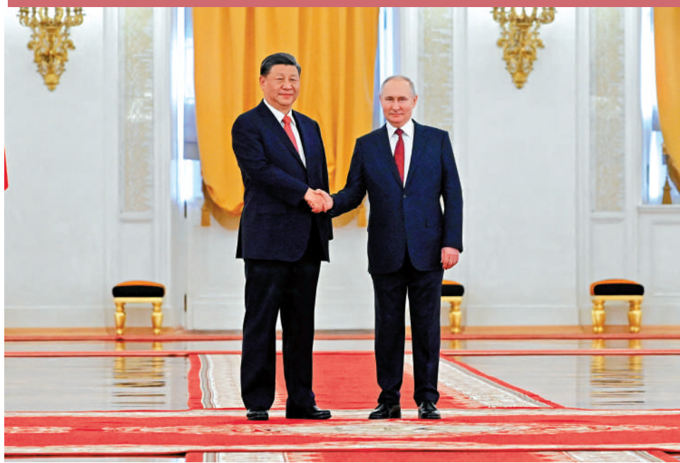
▲2023年3月21日，中國國家主席習近平出席俄羅斯總統普京在克里姆林宮喬治大廳舉行的歡迎儀式。