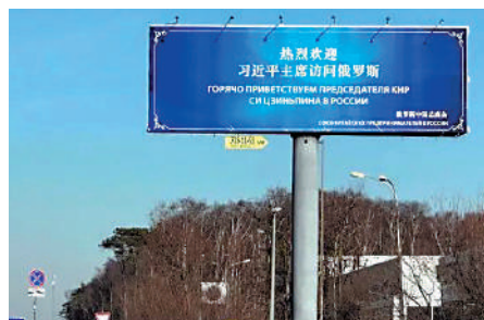
▲在莫斯科街頭隨處可見「熱烈歡迎習近平主席訪問俄羅斯」的歡迎標語。

米舒斯京表示，俄方願同中方加強投資貿易、能源、天然氣、和平利用核能、航空航天、科技創新、跨境交通物流等領域合作，就確保供應鏈產業鏈安全、糧食安全等問題加強溝通和合作。