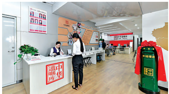
▲立遺囑趨年輕化，「微信遺囑」等立遺囑方式備受推崇。

【大公報訊】記者趙一存北京報道：涉及遺囑相關的問題近年備受關注，且立遺囑趨年輕化。中華遺囑庫21日在京發布的《2022中華遺囑庫白皮書》就顯示，立遺囑人平均年齡持續下降，30歲以下人群佔比近三成，「防止財產下落不明」是30歲以下立遺囑人主要考慮的風險。中華遺囑庫管委會主任陳凱介紹，這份白皮書通過對25萬份遺囑進行大