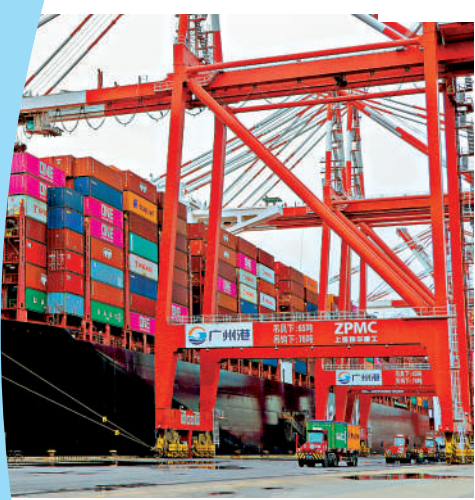
▲廣州港進出口繁忙。