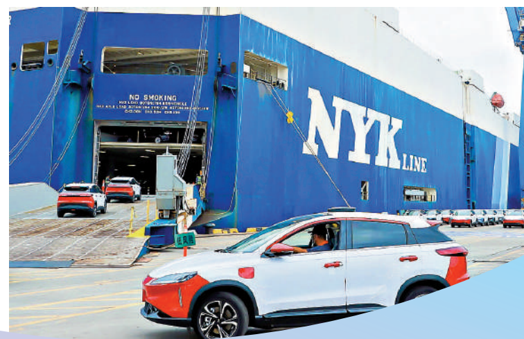
▶今年2月份，廣州南沙汽車口岸完成外貿商品出口量大增。

據了解，比亞迪汽車今年2月也正式進入日本市場，這是中國車企首次面向日本大眾市場銷售純電動汽車，國產新能源汽车出海又立下里程碑。截至今年2月，比亞迪新能源乘用車已經進入日本、德國、澳洲、巴西等國家，足跡遍布全球40多個國家和地區。數據顯示，今年2月比亞迪新能源乘用車銷量19.3萬輛，同比增長近1.2倍。