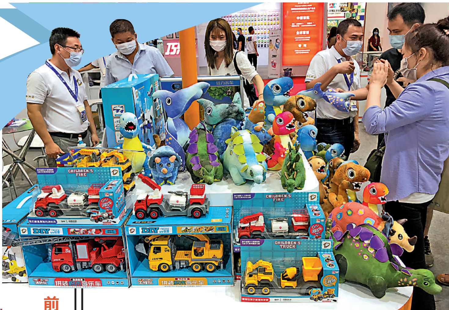
▶目前廣東企業加速外拓搶單，圖為玩具展示商家與客戶現場採購洽談。

廣東省商務廳有關負責人表示，隨著粵港經貿往來加速升溫，兩地攜手組團搶海外訂單，在一定程度上助力廣東外貿企穩回升趨勢。海關總署廣東分署數據亦顯示，新興市場潛力巨大，廣東企業正積極拓展而且成效顯現，拉美等新興市場進出口保持增長。今年前2個月，廣東對拉美的巴西、智利進出口分別增長24.8%、14.4%。