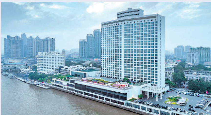
由港商霍英東與廣東省政府合資興建的廣州白天鵝賓館，是中國第一間合資的五星級賓館。

2014年，滬港通正式開通。隨後，又推出「深港通」和「債券通」，讓香港擁有進出內地資本市場的獨有渠道。