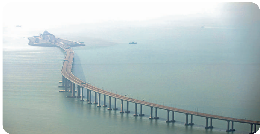
港珠澳大橋在2009年動工，2018年10月通車，是重要的涉港基礎建設。