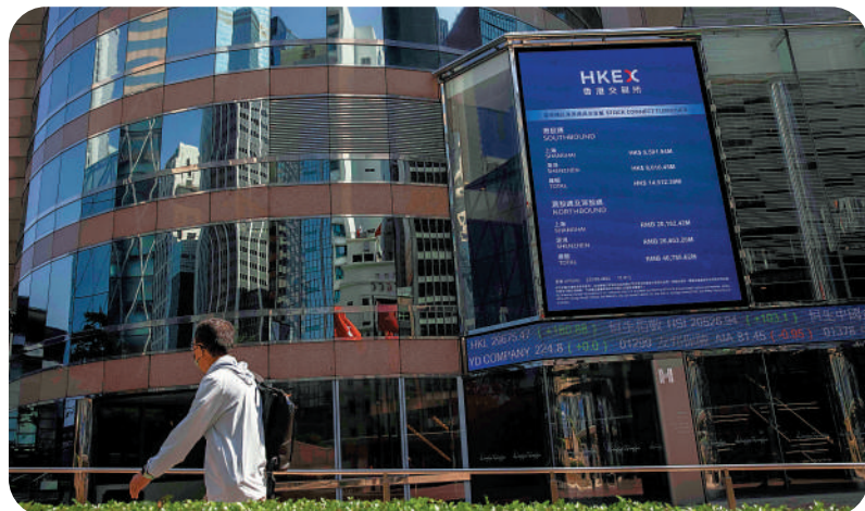
在國家政策支持下，「滬港通」2014年正式開通，隨後推出「深港通」和「債券通」，讓香港擁有進出內地資本市場的獨有渠道。