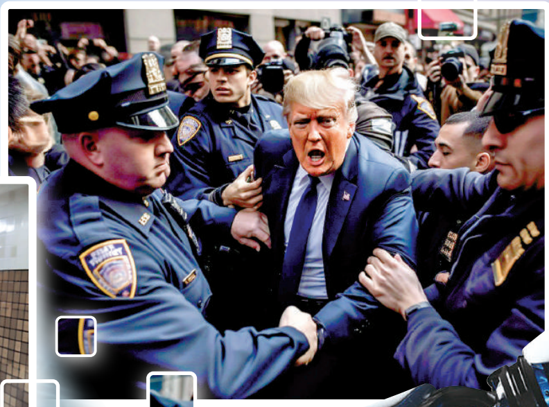
▲ AI合成的特朗普「被捕」照在社媒大肆傳播。

權利組織Access Now高級政策分析師勒弗表示，新技術發展速度過快，導致監管工作充滿挑戰。今年2月，OpenAI發布的AI聊天機器人ChatGPT爆紅後，包括微軟、谷歌（Google）在內的幾乎所有科技巨頭都參與到AI領域，以ChatGPT為代表的生成式AI技術的發展速度超出歐洲議員們的預料。