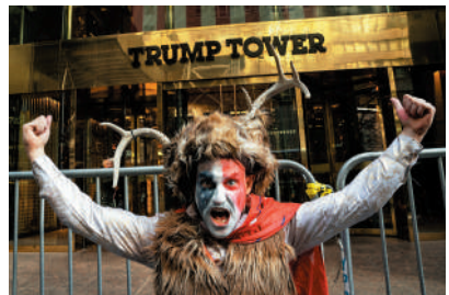
▲ 21日，打扮成國會暴亂中「牛角男」模樣的示威者站在紐約特朗普大廈前。

特朗普的黨內主要競爭對手、佛州州長德桑蒂斯20日加大力度抨擊特朗普，他以「封口費」和「色情明星」形容特朗普所牽扯的案件。