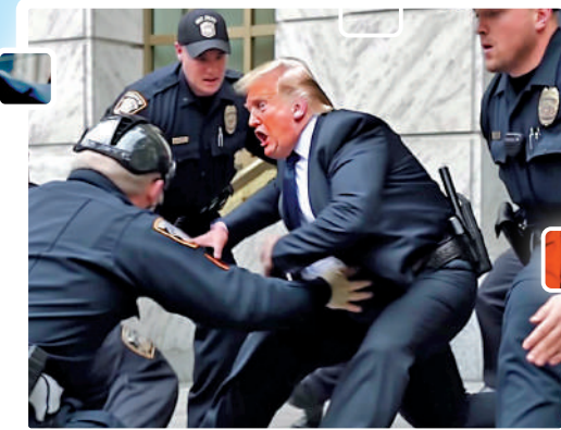
▲ AI製圖效果荒謬，特朗普佩有警棍和3條腿。

騙。布魯金斯學會AI和新興技術計劃主任梅瑟羅指出，「特朗普被捕」的照片或許無法讓人相信，但仍可以挑動公眾的情緒，如果特朗普的支持者或反對者受到畫面的刺激，可能做出衝動之舉。歐洲刑警組織去年發布報告，專家估計，到2026年，多達90%的網絡信息可能是由AI合成。