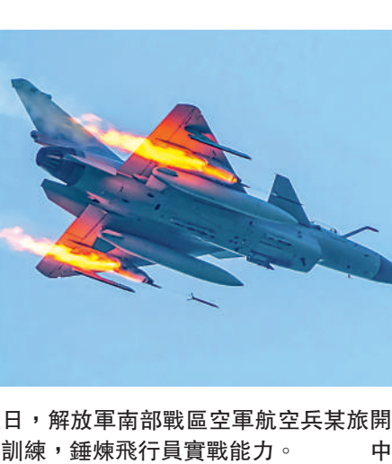
▲近日，解放軍南部戰區空軍航空兵某旅開展地靶實彈訓練，錘煉飛行員實戰能力。

汪文斌當日在例行記者會上還就美艦擅闖中國西沙領海作出回應。汪文斌指出，3月23日，美國海軍「米利厄斯」號軍艦未經中國政府允許，擅自進入中國西沙群島領海，侵犯中國主權，威脅中國安全，破壞有關海域的和平與安寧。中國人民解放軍南部戰區依法進行跟蹤監視並予以警告驅離。