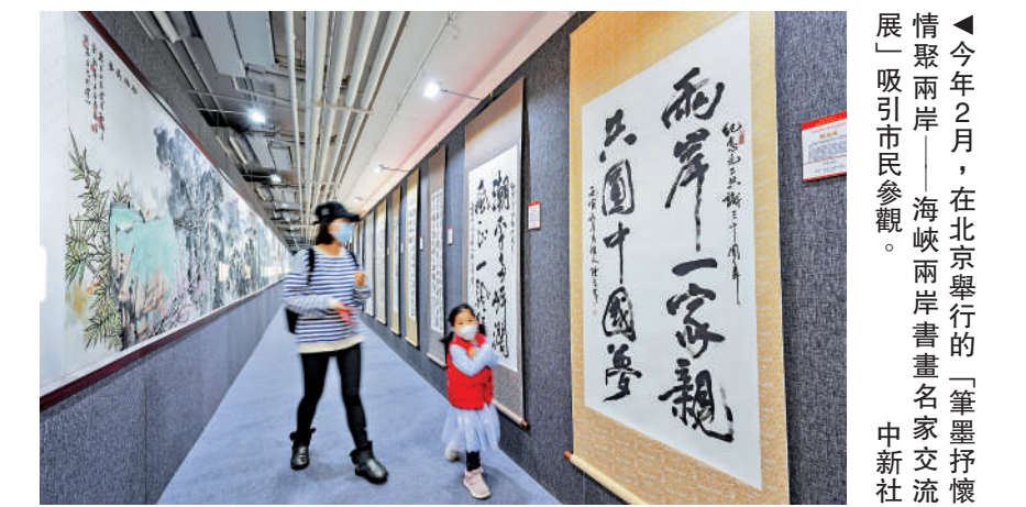
▲今年2月，在北京舉行的「筆墨抒懷情聚兩岸——海峽兩岸書畫名家交流展」吸引市民參觀。

田軍里指出，戰區部隊將時刻保持高度戒備狀態，採取一切必要措施，堅決捍衛國家主權安全和南海地區和平穩定。