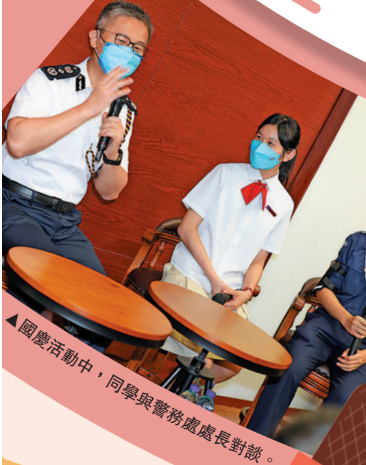
國慶活動中，同學與警務處處長對談。

在內地的暨南大學已有10至20位畢業生在那裏就讀或已完成學業，他們更計劃成立路德會西門英才中學校友會。校長寄語即使在不同的地方升學，只要將來學有所成，為社會、為國家出力，便是對教育工作者最大的回報。