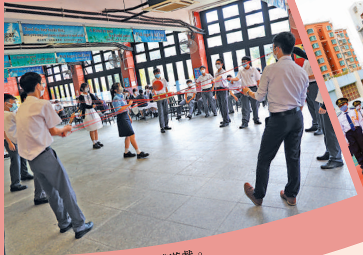
同學在國慶活動日進行團體遊戲。