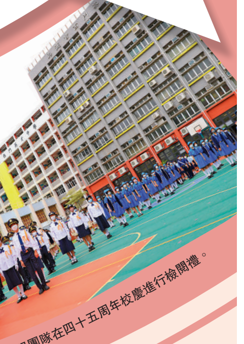
制服團隊在四十五周年校慶進行檢閱禮。