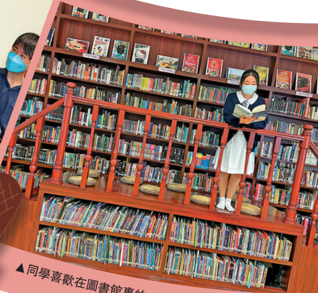
同學喜歡在圖書館裏的「知識之橋」上閱讀。