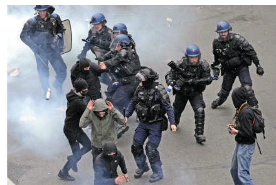
▲法國警察23日逮捕數百名暴力示威者。

退休改革之舉是「獨裁行為」。有示威者稱，法國的「民主已經崩潰，政府一意孤行」。法國內政部長達爾馬寧表示，在23日一天，全國範圍內有超過100萬人參加了抗議遊行，為此部署了1.2萬名安全人員，其中5000人被部署在巴黎。當天共有457人被捕，441名執法人員受傷；巴黎街頭共有903起縱火事件。他稱這是今年9輪罷工示威中「最暴力的一天」。