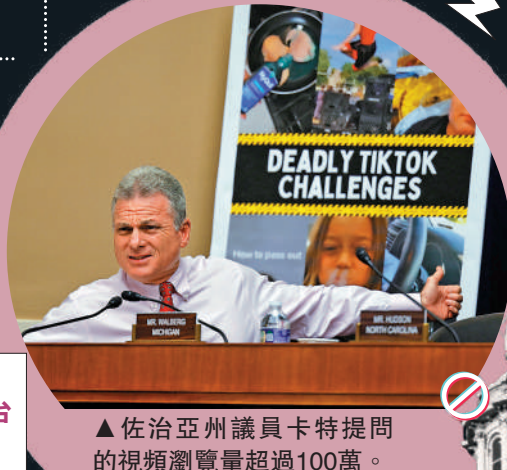
▲佐治亞州議員卡特提問的視頻瀏覽量超過100萬。

周受資：TikTok已經投入了很多應對這一挑戰，但不得不面對所在國的國情。我舉個例子，在我的祖國新加坡，TikTok上幾乎沒有涉毒內容，因為新加坡有着極為嚴格的打擊毒品的法律。