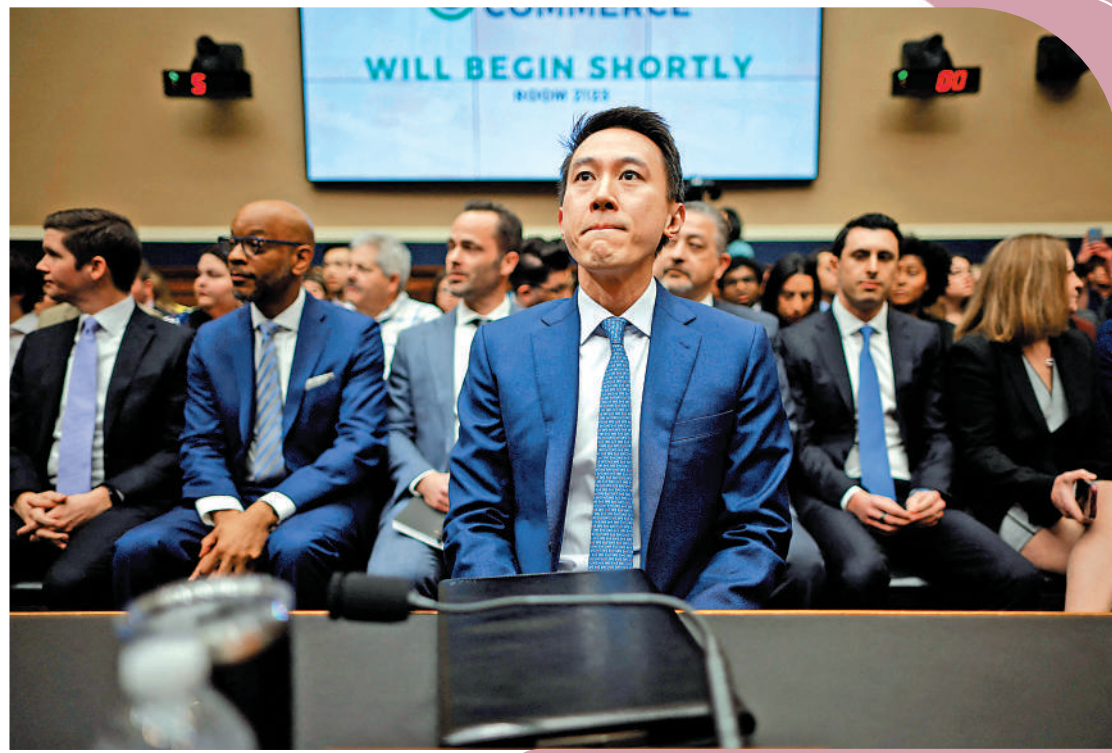
▲TikTok行政總裁周受資23日出席美眾議院聽證會。

新加坡籍的周受資當天上午10時出席眾議院能源和商業委員會聽證會。多家外媒注意到，這場聽證會自始至終充斥「敵對氣氛」，與以往涉及美國社交媒體平台CEO的國會聽證會明顯不同。50多名跨黨派議員口徑一致，連番指責TikTok與中國政府保持聯繫，質疑TikTok的透明度，要求周受資說明採取了什麼措施來確保美國用戶的隱私受到保護。