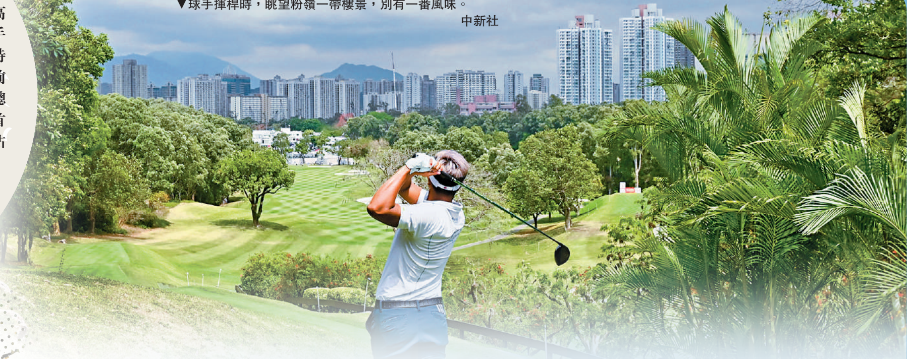
▼球手揮桿時，眺望粉嶺一帶樓景，別有一番風味。