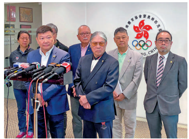
▲港協暨奧委會會長霍震霆(前排右一)認為冰協管理層在播錯國歌事件上責無旁貸。

港協暨奧委會認為今次事件責任，絕不應只由領隊獨力承擔。港協暨奧委會下周一向政府提交詳細報告，再共同商討懲處方法，重申相關決定是以整個冰球運動和運動員的發展為大前提，檢視冰協的企業管治絕不影響運動員及團隊。