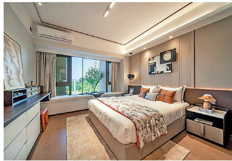
▲越秀·天悅金沙戶型多元化，在售單位間隔由三房至四房。

金沙洲區域面積26.8平方公里，交通配套設施逐漸改善，地鐵、有軌電車和跨江大橋陸續興建及正在規劃，未來出入市中心更加方便。其中，廣州地鐵12號線預計2024年通車，屆時由金沙洲可直達白雲山、二沙島等；廣佛大橋同樣預計2024年通車，成為西接佛山南海區，東往廣州主城區的重要通道，緩解金沙洲大橋的交通壓力；今年1月開工的沉香大橋，預計2025年12月建成，大橋西起佛山里水鎮，向東以橋樑形式跨越珠江及沉香島，終點為廣州白雲區。