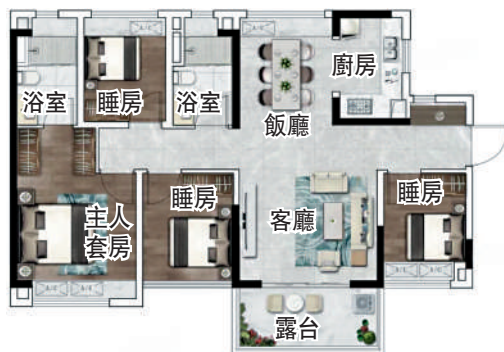
▲中建·星光城100平米四房兩廳戶型圖。 ▲中建·星光城共10幢高層住宅，蝶形布局，讓每戶景觀最大化。

黃金圍的全新住宅項目中建·星光城，距地鐵8號線首發站潭心直線距離僅400米，一線直達荔灣、海珠，便捷換乘14條地鐵線。區內還規劃打造潭心地鐵TOD（公共交通導向型開發）商業綜合項目，引進嶺南水鄉創意產業園、商業教育、體育中心等業