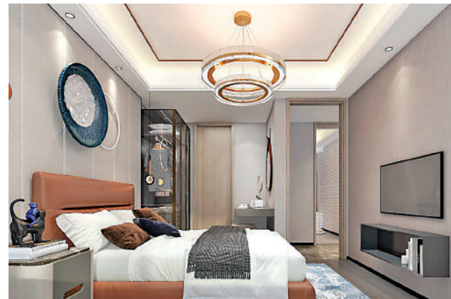
▲中建·星光城提供1391伙，間隔方正實用。

此外，中建國際在白雲區安置房項目配建學校，這為黃金圍板塊再添一所九年一貫制54班學校，中建·星光城直線距離該學校僅約300米；百米之內有15班幼兒園，3公里範圍內有紅星小學、潭心小學、石井中學，12年教育配套完善。