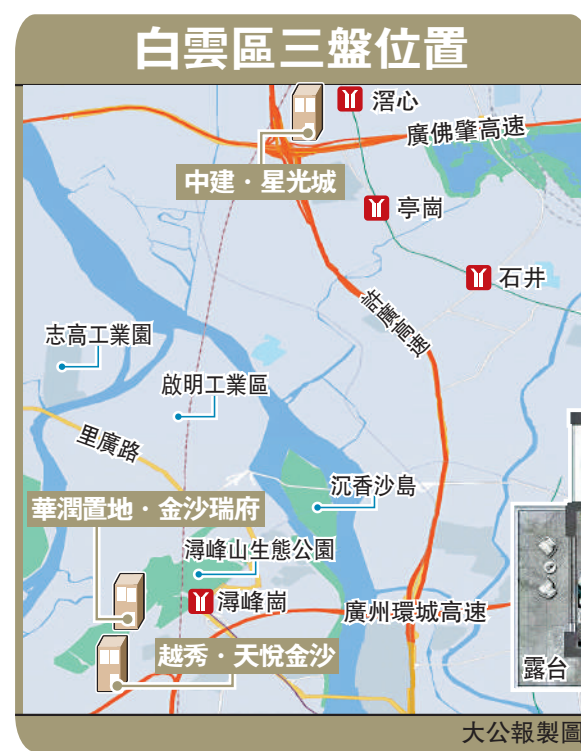
▲越秀·天悅金沙141平米四房兩廳戶型圖。

附實驗小學、廣附實驗初中，業主子女在家門口即可完成全年齡段教育學習。生活配套方面，步行約800米即可到永旺夢樂城。另外，三甲醫院廣州中醫藥大學金沙洲醫院僅距10分鐘車程。