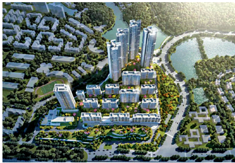
▲越秀·天悅金沙規劃為33幢住宅，其中四幢超高層立於北側，望向山景和湖景。