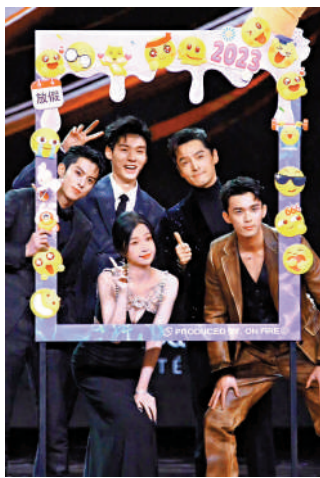
▲吳磊、王鶴棣、龔俊、虞書欣四位演員同台領獎。

不少久違的「CP」在昨晚團聚。去年憑藉《蒼蘭訣》、《星漢燦爛·月升滄海》等熱播劇而倍受歡迎的吳磊、王鶴棣、龔俊、虞書欣四位演員同台領取微博年度矚目演員。而大獎「微博KING」和「微博QUEEN」歸屬於曾共同出演過《仙劍奇俠傳》的胡歌與劉亦菲。