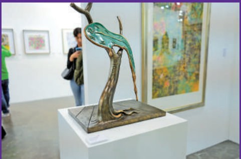
▲薩爾瓦多·達利的雕塑作品《時間的側影》。

經歷了2020年的停辦，2021年的線上展覽，今年的巴塞爾藝術展呈獻2019年來最大規模香港展會。村上隆、蜷川實花等藝術家親臨現場，吸引大量藝術愛好者慕名前來合影。草間彌生標誌性的黃色「南瓜」、波點花紋展品成為熱門「打卡點」，現場觀眾為與「南瓜」合影甚至自覺排起了隊。 今年現場藝術裝置繁多，現場韓國藝術家金泓錫的作品《沉默的孤獨》以及荷蘭籍現居印尼藝術家Mella Jaarsma的作品《The Constructor》尤其受到歡迎。