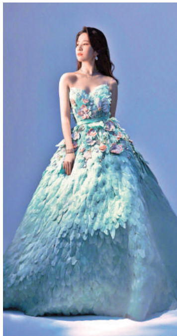
▲劉亦菲展現迪士尼公主的風采。