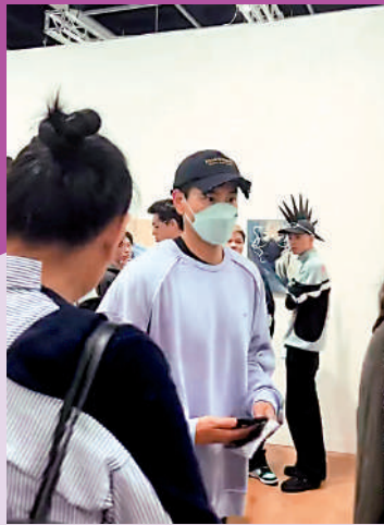
▲彭于晏被現場偶遇。

伴隨「口罩令」的撤銷，記者觀察到，展場已經很少有觀眾戴口罩了。觀眾林小姐同記者感嘆，現場的盛況「好似回到4年前，彷彿疫情沒有發生過。這次更能夠躬逢其盛、欣賞到這麼多有意思的作品，感到心情愉快。」同過往一樣，今年巴塞爾藝術展仍舊吸引了大量明星入場，梁朝偉、鍾鎮濤、佘詩曼、余文樂、唐詩詠等都在社交平台貼文分享現場見聞，而彭于晏、關之琳等更被現場偶遇，盛況可見一斑。