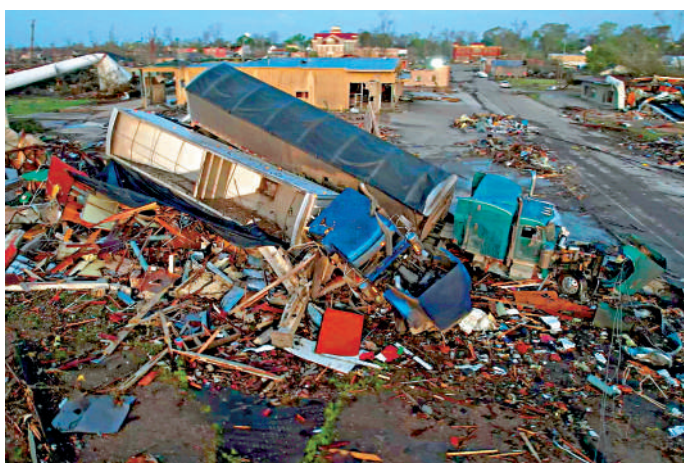
►密西西比州遭龍捲風襲擊，災區滿目瘡痍。

狀態」，並下令為受災地區提供聯邦援助。密西西比州傑克遜國家氣象局氣象學家普萊斯稱，龍捲風災持續了大約一小時，造成約