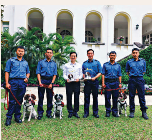
◀行政長官李家超昨天宴請消防「明星犬」，狗狗在草地上興奮玩耍。