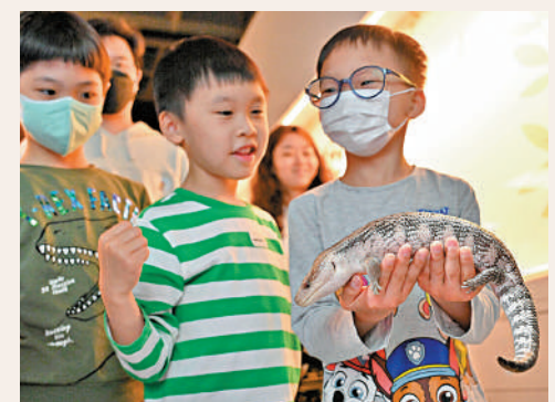
▲科學館舉辦親親兩棲爬行動物生物多樣性工作坊，小朋友可接觸藍舌石龍子。