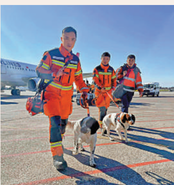
▲Twix及Umi早前到土耳其地震災區救援。