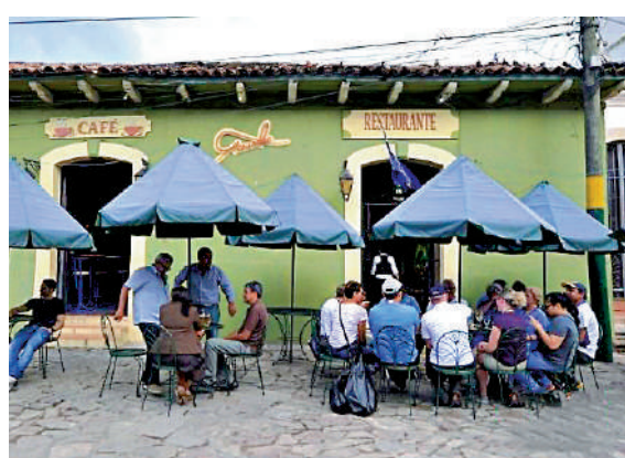
▲洪國中西部城市科馬亞瓜的一家餐廳景象。