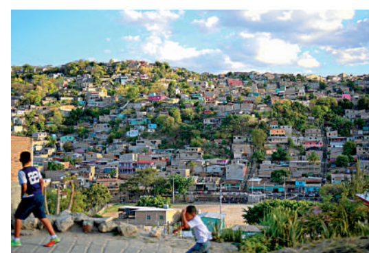
◀中方願參與洪國惠民生項目。這是3月25日拍攝的洪都拉斯科馬亞瓜一處村莊。

雷納表示，中洪建交是歷史性的一步，開啟了造福洪中人民的新時代。洪都拉斯承認世界上只有一個中國，中華人民共和國政府是代表全中國的唯一合法政府，台灣是中國領土不可分割的一部分。洪方願同中方加強金融、貿易、基礎設施、科技、文化、旅遊等領域合作，密切在多邊框架下溝通協調。洪方致力於維護國家主權和尊嚴、維護不干涉內政原則、維護人民自決權，同中國建交符合上述原則。感謝中方對卡斯特羅總統的訪華邀請，相信這一訪問不僅將造福兩國人民，也將造福全人類。