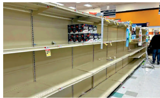
▲ 美國賓夕法尼亞州一家工廠發生化學品洩漏流入特拉華河，費城民眾26日在超市搶購瓶裝水。

裝水。賓夕法尼亞州環境保護部門表示，水採樣正在進行中，飲用水攝入處沒有檢測到污染物。魚類和野生動物沒有受到影響。據悉，特拉華河為該市58%的地區供水，同時也是全美四個州約1400萬人口的主要飲用水源。