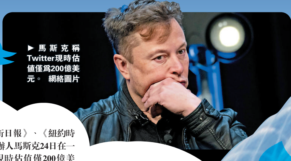
▶ 馬斯克稱Twitter現時估值僅為200億美元。

【大公報訊】綜合《華爾街日報》、《紐約時報》報道：特斯拉（Tesla）創辦人馬斯克24日在一封內部郵件中表示，Twitter現時估值僅200億美元，不及收購價的一半。另外，Twitter被發現部分源代碼外洩到網上，目前已緊急採取法律行動。據悉，外洩代碼可能是一名前僱員。據報道，由於源代碼中含有安全漏洞，或會導致黑客輕鬆提取Twitter用戶數據甚至是直接關閉網站。