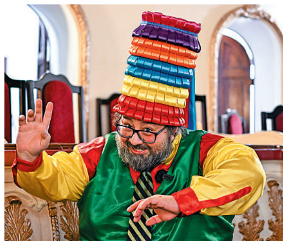
▲一名藝人在洪都拉斯首都特古西加爾巴的一處劇院內表演。

台灣《中國時報》日前稱，巴拉圭即將於4月30日舉行總統大選，反對黨的候選人艾里格時曾表示，若勝選將與台當局「斷交」，與大陸發展關係，他後來改口稱若繼續支持台灣，就要得到更多承諾，因此「仍不能排除其當選後跟台灣『斷交』的可能性」。巴拉圭農牧協會、肉品商會等，都敦促該國政府與大陸談判相關商品進入大陸市場。