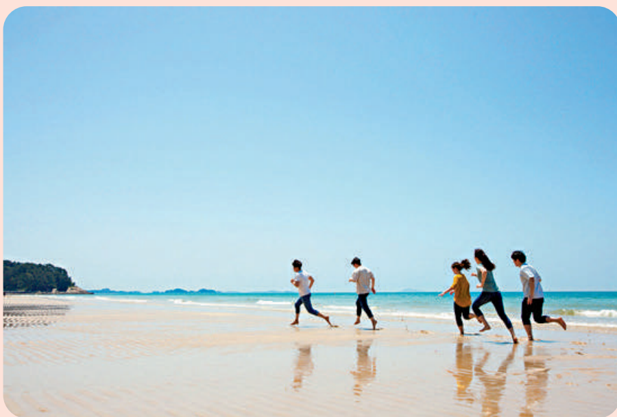
▲夏天總是跟熱情奔放聯繫在一起，往往教人想起青蔥歲月。

就如史鐵生所說：「夏季是一部長篇小說。」夏天噴薄而出pēn bó ér chū的太陽就如同我們最熱烈的情感，伴隨我們走過最難忘的年齡，即使夏天結束了，我們終其一生都在懷念夏天，夏天情結包容了我們對所有熱烈的、衝動的、遺憾的、過去的懷念。林徽因在詩歌《八月的憂愁》中寫道：「從沒有人說過八月什麼話，夏