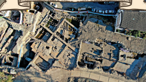
▲浙江溫州朔門古港遺址發掘出的古碼頭遺址。