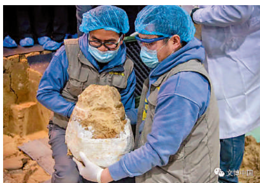
▲工作人員小心翼翼地捧出「鄖縣人3號頭骨」。

全，各方共同努力，在學堂梁子遺址創新性地搭建了1000多平方米溫濕可控、設施齊全、功能完備的考古方艙和考古工作站，引進了考古發掘數字管理平台、ArcGIS系統和最新的發掘記錄系統。「鄖縣人」3號頭骨面世後，團隊採用最新的田野考古規程和前沿科技手段，多學科聯合攻關，對埋藏頭骨化石的部位及時進行了擴方發掘。圍繞人類化石和其他遺存，考古團隊系統採集了1400多份樣品，用於年代、環境、埋藏、殘留物和分子生物學分析等多學科研究，拍攝了20多萬張高清照片，進行了20多次的高分辨率實景三維建模，留取了海量影像與數據資料。