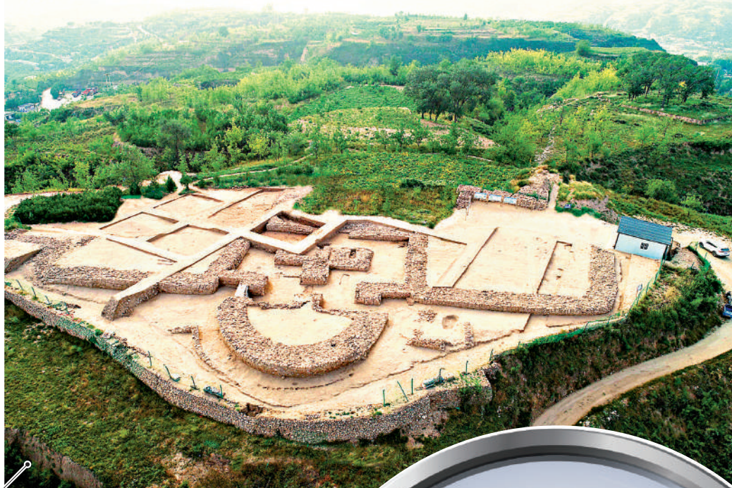
▲山西興縣碧村遺址入選2022年度全國十大考古新發現。新華社

全國十大考古新發現推介活動由國家文物局主管，中國文物報社、中國考古學會主辦，是在全國範圍內推介並宣傳當年重大考古發現的一項重要活動，今年是第33屆。本屆推介活動共收到32個參評考古項目，經過初評、終評等環節選出十大考古新發現。