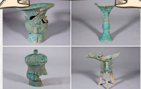
▲河南安陽殷墟商王陵祭祀坑K23出土的青銅器。