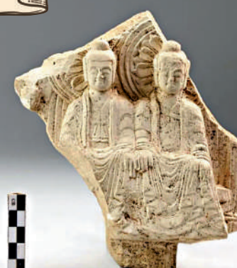
▲吉林琿春古城村寺廟址出土的佛像殘片。新華社