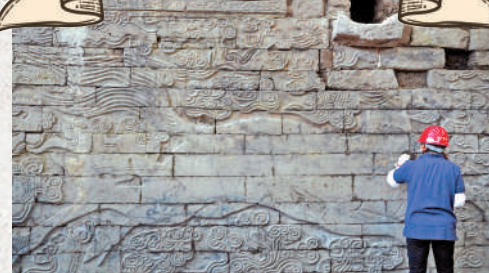
▲工作人員清理河南開封州橋遺址出土的壁畫。