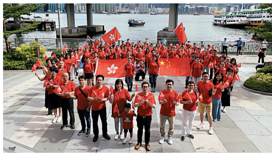
每年七一香港回歸紀念日，都會有團體組織唱國歌活動。