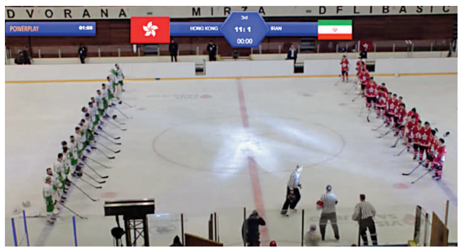
世界冰球錦標賽早前發生播國歌出錯事件，港協暨奧委會初步認為冰協未有遵從相關指引。