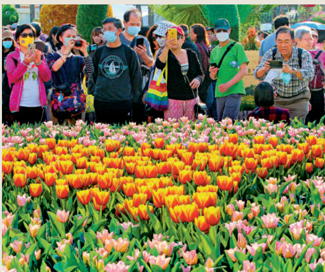
▲「香港花卉展覽」吸引許多市民參觀，日前在維園圓滿結束。