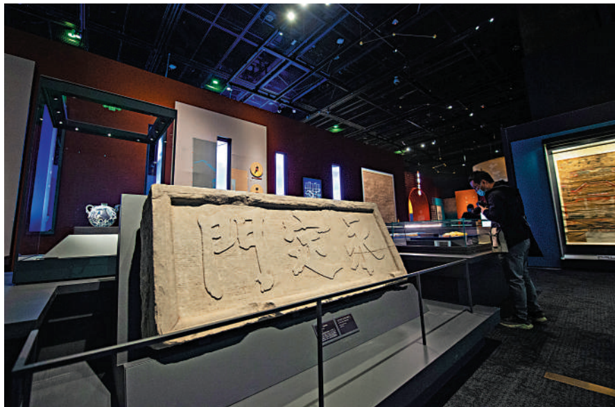
▲展出的永定門石匾。

台上的樂手們不年輕了，他們站着演奏而不是坐着。以弦樂為主，大提琴、中音提琴、低音提琴，以及木管、古鋼琴。有一位女小提琴手，大概已經六七個月的身孕。那是一場巴羅克時代的宮廷音樂，旋律優雅懷舊。在結尾的那一段，指揮家勞倫斯轉過身來，面向