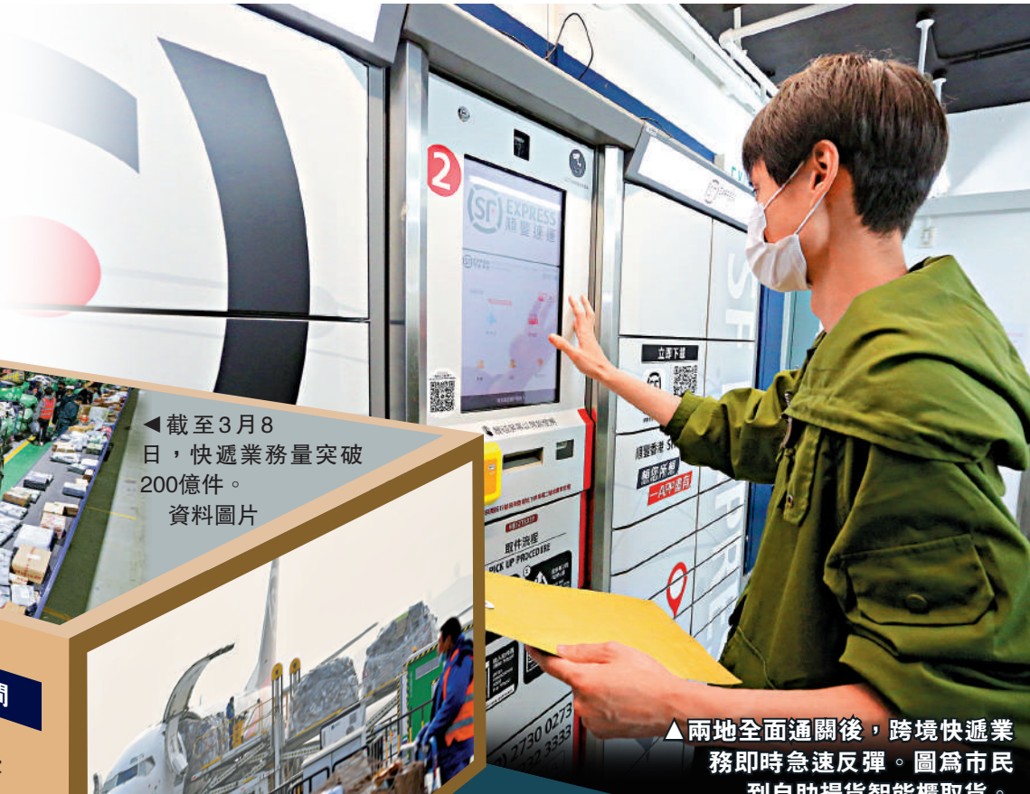
▲兩地全面通關後，跨境快遞業務即時急速反彈。圖為市民到自助提貨櫃取貨。

記者致電順豐深圳客服，查詢寄往香港的快遞情況，職員表示，內地發往香港的快遞早已全面復常，深圳發往香港特快，如今日傍晚寄，翌日傍晚6時前即可收到，2公斤內運費42元人民幣。