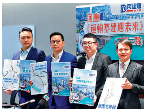
▲民建聯就《跨越2030年的鐵路及主要幹道策略性研究》提出15項完善建議。

【大公報訊】政府的《跨越2030年的鐵路及主要幹道策略性研究》，制訂遠至2046年及以後的主要運輸基建發展藍圖。