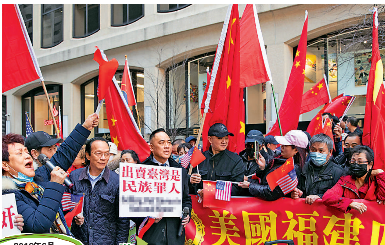
當地時間3月29日，針對台灣當局領導人蔡英文「過境」美國，美國華僑華人社團在紐約舉行示威活動，抗議其竄美，譴責其挑戰一個中國原則。

2016年6月 蔡英文出訪巴拿馬、巴拉圭，並「過境」美國邁阿密、洛杉磯；2016年12月中國大陸與曾是台灣地區「友邦」的聖多美和普林西比恢復外交關係。