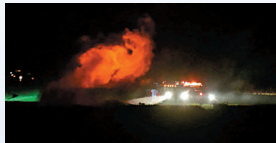
▲兩架黑鷹直升機29日在肯塔基州墜落後起火。

一款改良型黑鷹直升機，具有空中突襲、醫療後送及其他的不同用途，一架黑鷹直升機可以運送一個11人的步兵班。