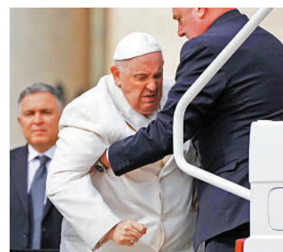
▲方濟各29日需在他人幫助下上車。

方濟各近年受到健康問題困擾，包括患上結腸憩室炎，並於2021年接受手術切除部分結腸。他曾在今年1月表示，結腸憩室炎病情再次復發，令他體重增加，但自己沒有過度擔憂。方濟各同時患有足部問題，因此不時使用拐杖或輪椅現身公開場合。去年12月，方濟各透露，他已擬定一封備用辭職信，預備一旦他因病無法履行職務時將辭職。