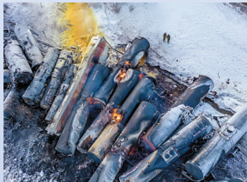
▲明尼蘇達州一列載有危險品的火車30日脫軌。美聯社

布蒂格格說，鑒於火車上載有危險物質，環境保護局的官員也已趕往現場。BNSF發言人肯特在聲明中表示：「鐵路主軌道被堵塞，線路的重新開放時間無法確定。」