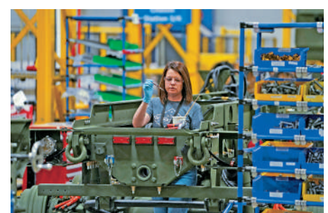
▲洛克希德馬丁負責的項目或被美空軍叫停，圖為該公司的武器製造工廠。