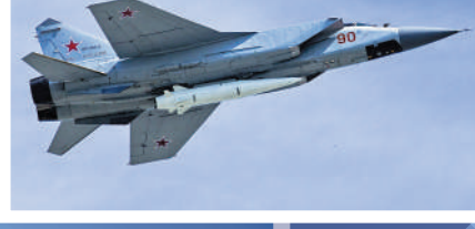
▲俄羅斯「匕首」高超音速導彈已投入戰場。

去年3月20日，俄羅斯國防部宣布，俄羅斯「匕首」高超音速導彈摧毀了烏軍在西部尼古拉耶夫州的一個大型軍事燃料基地，按照俄專家的說法，這是人類歷史上第一次在實戰中投入高超音速武器。