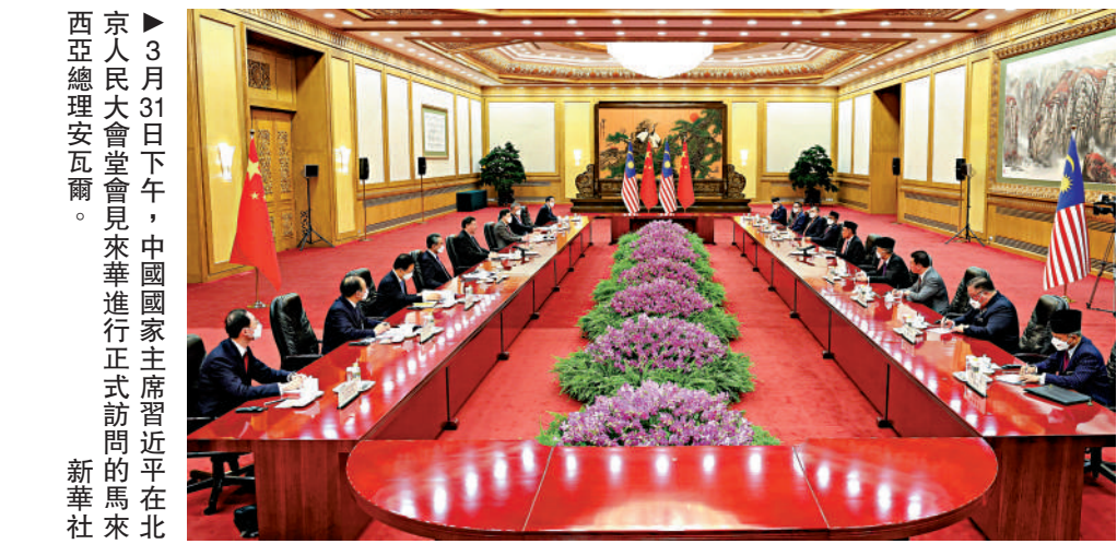
3月31日下午，中國國家主席習近平在北京人民大會堂會見來華進行正式訪問的馬來西亞總理安瓦爾。

雙方就烏克蘭危機交換了意見。習近平強調，中方立場一以貫之、清晰明確，就是勸和促談、政治解決。應該摒棄冷戰思維和陣營對抗，放棄極限制裁施壓。希望有關各方通過對話協商，構建均衡、有效、可持續的歐洲安全架構。