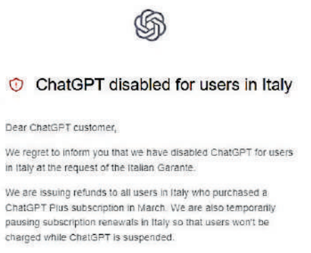
ChatGPT disabled for users in Italy

ChatGPT網頁發出公告，表示正面向在3月訂閱ChatGPT Plus的意大利用戶退款，「將致力保障民眾的私隱，亦深信ChatGPT已遵守GDPR及其他私隱法例」。OpenAI也表示，正積極減少利用個人數據訓練AI系統，「希望AI能夠認識世界，而非特定個人。」但是，OpenAI沒有詳細透露如何收集數據