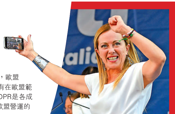
▲意大利當局宣布暫時禁止使用ChatGPT，圖為意大利總理梅洛尼。

三星回應稱，已加強ChatGPT的相關安全設置，並將進一步加強內部監管和員工培訓。而三星機密資料外洩的事故也提醒了其他企業，使用AI時需採取相應的策略與措施，以最大限度地減少機密信息的洩露。