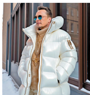
▲馬斯克晒出一張AI生成、自己身穿羽絨服的照片。