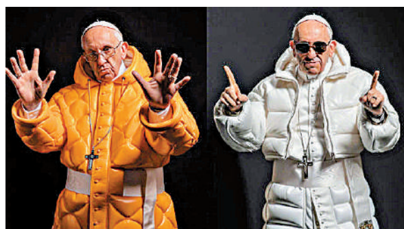
▲天主教教宗方濟各身穿羽絨服的照片近期爆紅。

感嘆「教宗是時尚偶像」，甚至連電子報Garbage Day作者布羅德里克也表示，「看上去有點酷」。不過，也有部分網友指出圖片已被推特（Twitter）標上「AI虛假圖像」的提醒。