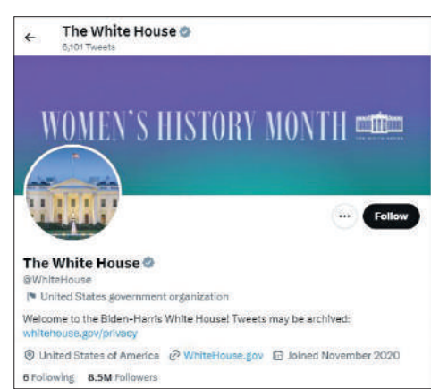
▲白宮的推特賬號。

據報道援引消息人士的話，該指引未來有可能擴展至美國的其他政府部門或機構。白宮當前在Twitter擁有多個賬號，